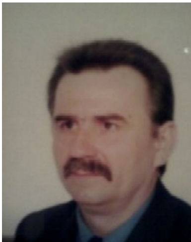
Prezes Stowarzyszenia "Victoria"

czwartek, 07 marca 2013 14:07 - Poprawiony niedziela, 17 marca 2019 20:49