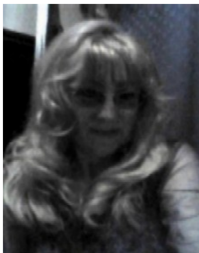
Koordinator Programu na 2019 rok

Za wrażliwość społeczną serdecznie dziękujemy i zapraszamy do współpracy